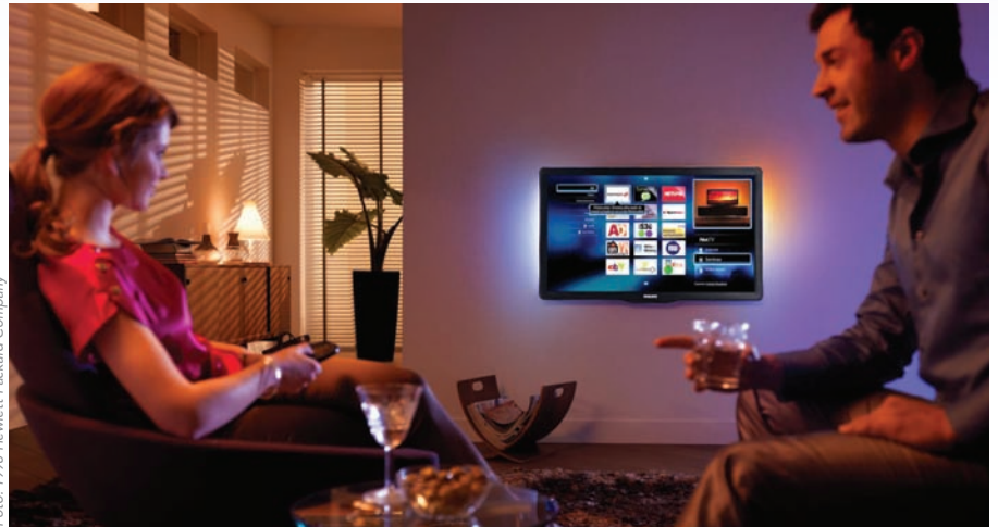
Stark im Kommen: Fernseher, wie z.B. hier von Philips, die internetfähig sind

Mittelfristig wird das wohl das Aus für den Videotext bedeuten. Allerdings dürfte das zu verschmerzen sein. Denn die Zukunft verspricht ganz andere, praktischere Anwendungen: Künftig wird man über den Fernseher kontrollieren können, ob der Herd ausgeschaltet ist oder ob in der Wohnung andere Elektrogeräte unnötig laufen.