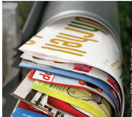
Oft im Briefkasten, weniger oft verständlich: Werbung

HD+ ist eine digitale Plattform der Privatsender RTL HD, Vox HD, Sat1 HD, Pro7 HD und Kabel1 HD, über die sie ihre hochauflösenden Programme senden. HD+ ist kostenpflichtig und deshalb verschlüsselt. Soweit der Fernseher nicht über eine CI+-Schnittstelle und einem CI+-Modul verfügt, wird für den Empfang ein digitaler Kabelreceiver mit dieser Ausstattung benötigt.